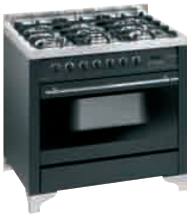
Y9G 55 1 AV C.000R

Cucina a 5 fuochi con forno elettrico ventilato - 8 funzioni - Bruciatore a tripla corona - Accensione elettronica sulla manopola - Valvole di sicurezza - Griglie in ghisa con gommini antiscivolo e antirumore - Maxi forno, 77 litri - Nuova controporta tutto vetro facile da smontare - Programmatore digitale di inizio e fine cottura - Girarrosto - Classe di efficienza energetica A - Dimensioni LxAxP 900x956x600 mm