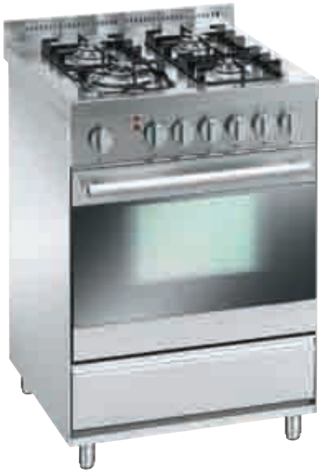
EK 66433 AV X