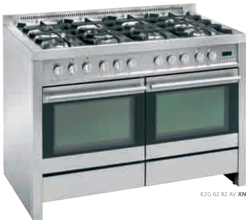
K2G 62 82 AV XN

AV inox nero • stainless-steel and black glass K2G 62 82 AV XN