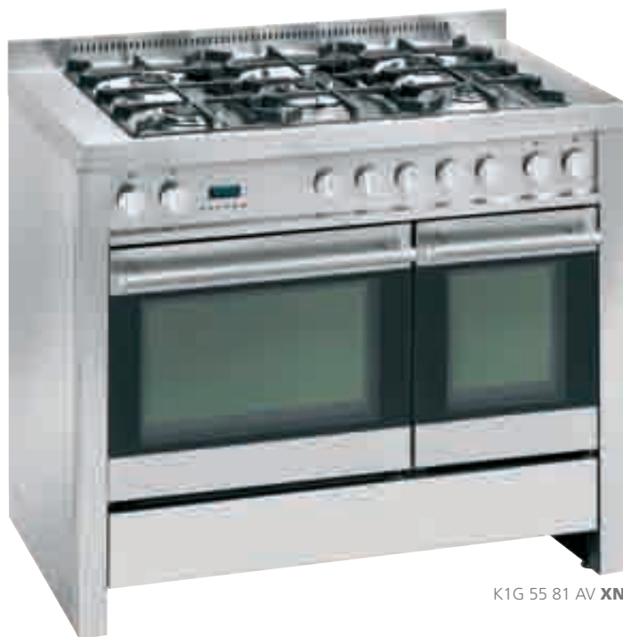
K1G 55 81 AV XN

AV inox nero • stainless-steel and black glass K1G 55 81 AV XN