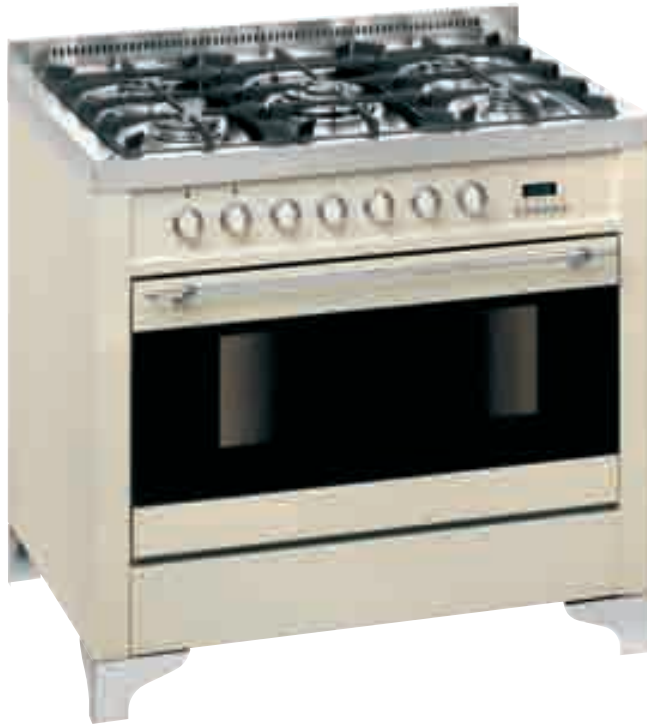
Y9G 55 1 AV A.000R