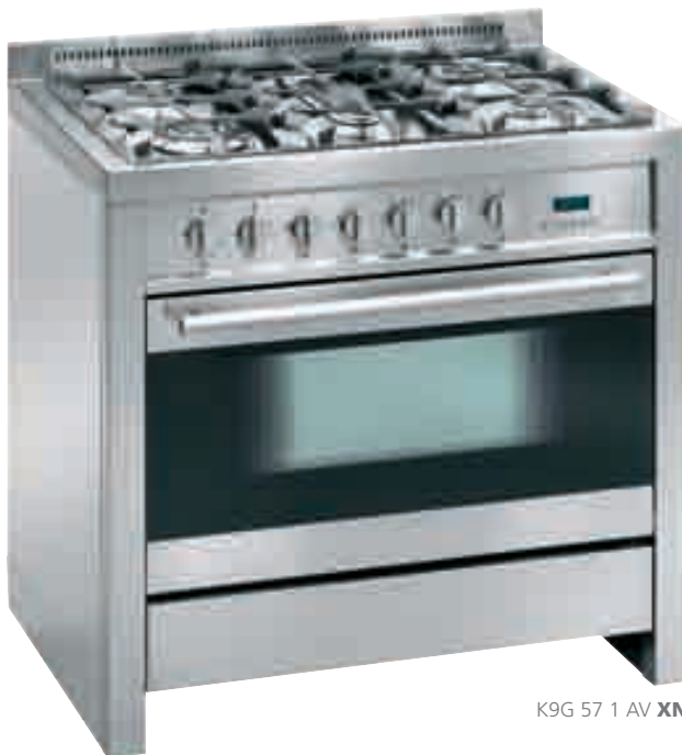
K9G 57 1 AV XN

AV inox nero • stainless-steel and black glass K9G 57 1 AV XN