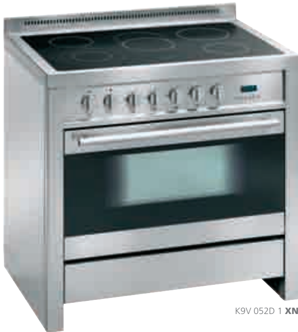
K9V 052D 1 XN

inox nero • stainless-steel and black glass K9V 052D 1 XN