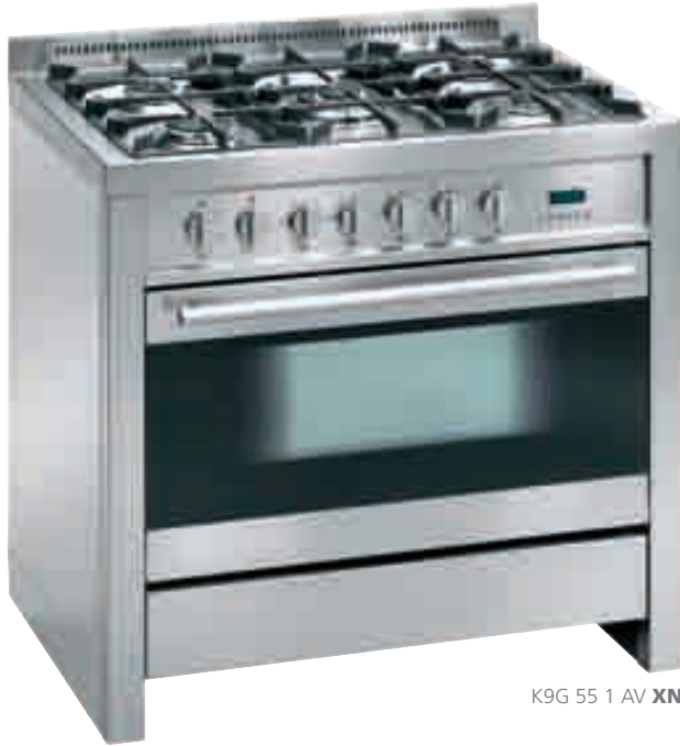
K9G 55 1 AV XN

AV inox nero • stainless-steel and black glass K9G 55 1 AV XN