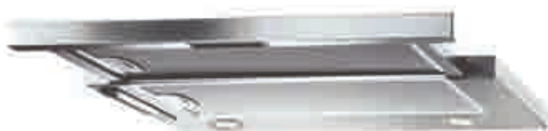
NTA 16 02 X

Cappa integrata telescopica - Aspirazione massima 301 m 3 /h - 2 motori - 2 lampade alogene - 3 velocità regolabili tramite slider - Filtri in alluminio anodizzato a 5 strati lavabili in lavastoviglie - Dotata di riduzione e valvola di non ritorno - Schema di incasso F 24