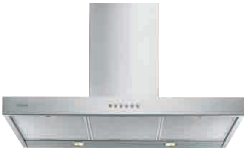
NCA 79 01 X

inox • stainless-steel NCA 79 01 X optional filtro al carbone attivo • active carbon filter TWACK 62260