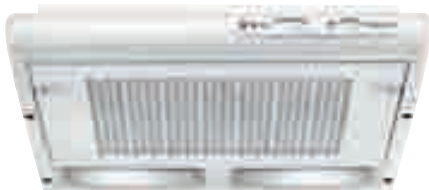
TN 45 W