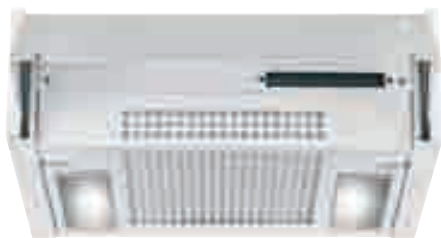
TN 45 E W

nero • black TN 45 E N bianco • white TN 45 E W optional filtro al carbone attivo • active carbon filter RN-BA1231