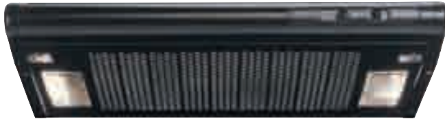
TN 60 N