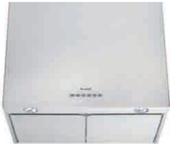
NCA 86 01 X

inox • stainless-steel NCA 86 01 X optional kit conversione filtrante • filter conversion kit TW KIT 0022 optional filtro al carbone attivo • active carbon filter TWACK 62260