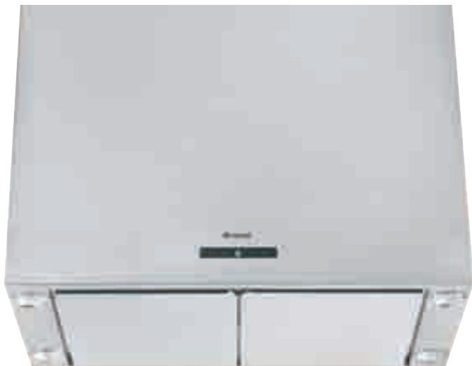
NCAI 87 01 X