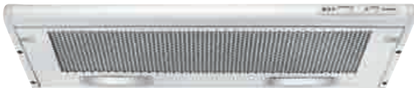
TN 90 W

Cappa integrata - Aspirazione massima 280 m 3 /h (1 motore) - 420 m 3 /h (2 motori) - 2 lampade - 3 velocità regolabili tramite cursore - Filtri in alluminio - Schema di incasso F 4