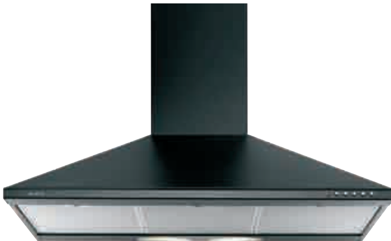
NCA 49 01 N

nero • black NCA 49 01 N ramato • copper NCA 49 01 R inox • stainless-steel NCA 49 01 X optional filtro al carbone attivo • active carbon filter TWACK 62259