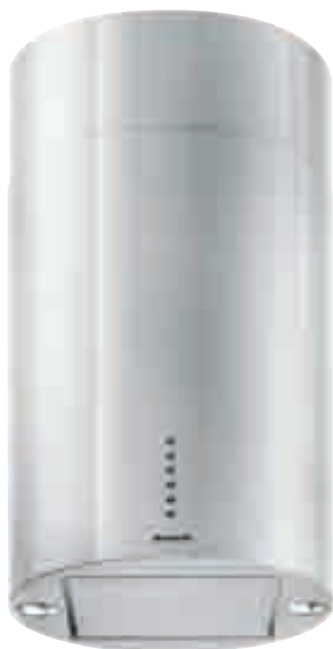
NCAI 64 01 X

inox • stainless-steel NCAI 64 01 X optional kit conversione filtrante • filter conversion kit TW KIT 0020 optional filtro al carbone attivo • active carbon filter TWACK 62260