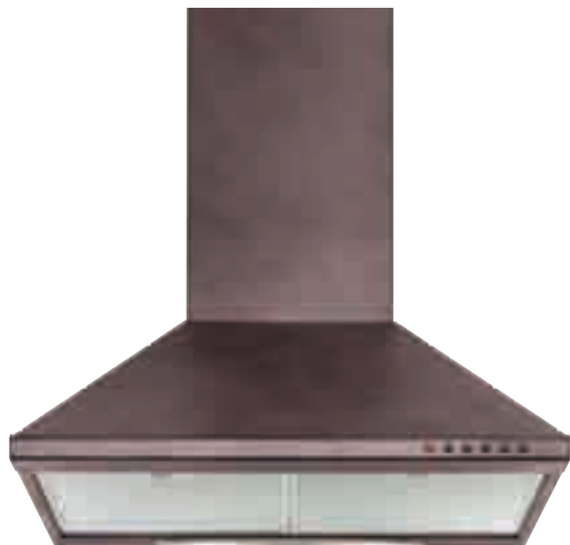
NCA 46 01 R

nero • black NCA 46 01 N ramato • copper NCA 46 01 R inox • stainless-steel NCA 46 01 X optional filtro al carbone attivo • active carbon filter TWACK 62259