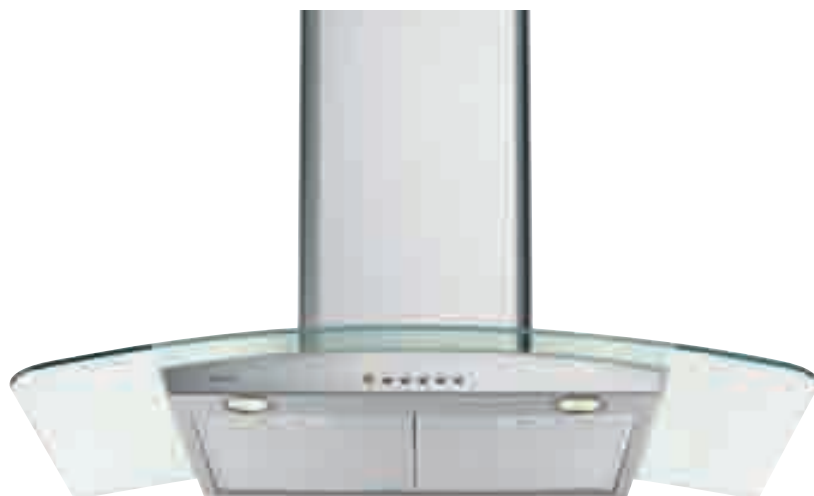
NCA 39 01 C X

inox • stainless-steel NCA 39 01 C X optional filtro al carbone attivo • active carbon filter TWACK 62260