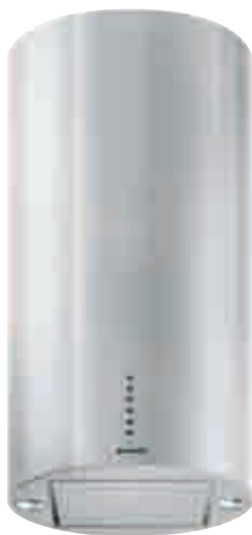
NCA 64 01 X

Cappa a camino - Aspirazione massima 756 m 3 /h - 1 motore tangenziale con ventola - 2 lampade alogene - 3 velocità regolabili tramite pulsanti - Funzione booster - Timer - Aspirazione perimetrale - Filtri in alluminio anodizzato a 5 strati lavabili in lavastoviglie - Spia lavaggio filtri - Dotata di riduzione e valvola di non ritorno - Schema di incasso F 22