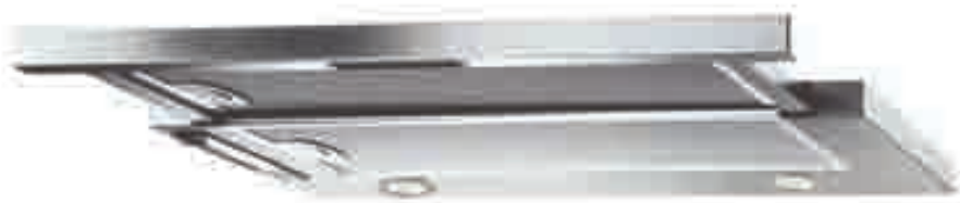
NTA 19 02 X

Cappa integrata telescopica - Aspirazione massima 301 m 3 /h - 2 motori - 2 lampade alogene - 3 velocità regolabili tramite slider - Filtri in alluminio anodizzato a 5 strati lavabili in lavastoviglie - Dotata di riduzione e valvola di non ritorno - Schema di incasso F 23