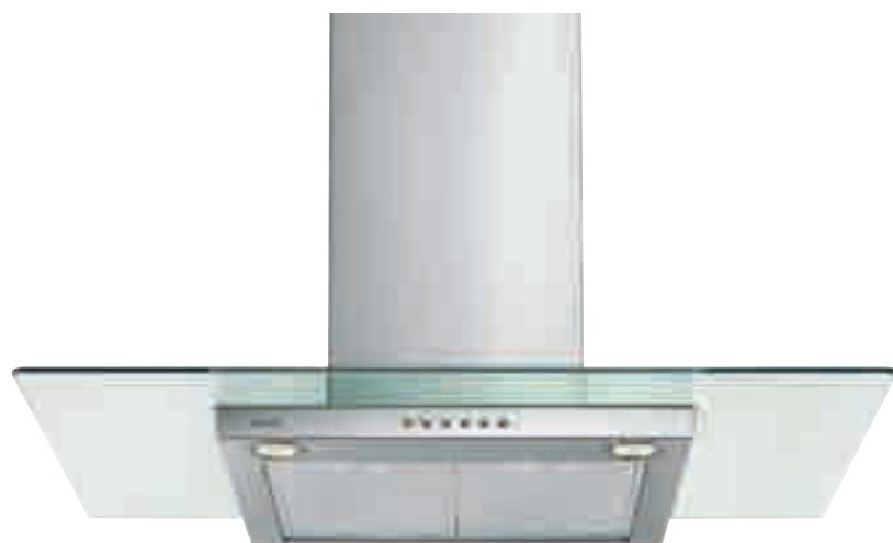
NCA 29 01 C X

inox • stainless-steel NCA 29 01 C X optional filtro al carbone attivo • active carbon filter TWACK 62260