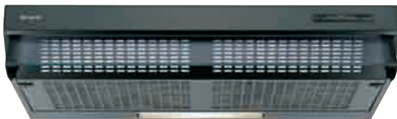
NCF 19 01 N

nero • black NCF 19 01 N bianco • white NCF 19 01 W optional filtro al carbone attivo • active carbon filter TWACK 62258