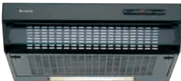
NCF 16 01 N

Cappa sottopensile con frontalino estraibile in vetro - Aspirazione massima 212 m 3 /h - 1 motore - 1 lampada - 3 velocità regolabili tramite cursore - Filtri in acrilico - Avvisatore ottico - Foratura posteriore per uscita a muro - Dotata di riduzione e valvola di non ritorno - Schema di incasso F 10