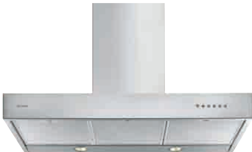
NCA 99 01 X

inox • stainless-steel NCA 99 01 X optional filtro al carbone attivo • active carbon filter TWACK 62260