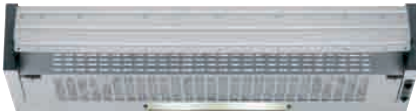
NCE 19 01 H

Cappa sottopensile - Aspirazione massima 176 m 3 /h - 1 motore - 1 lampada - 3 velocità regolabili tramite cursore - Filtri in acrilico - Avvisatore ottico - Dotata di riduzione e valvola di non ritorno - Frontalino smontabile per facile montaggio del pannello - Schema di incasso F 15