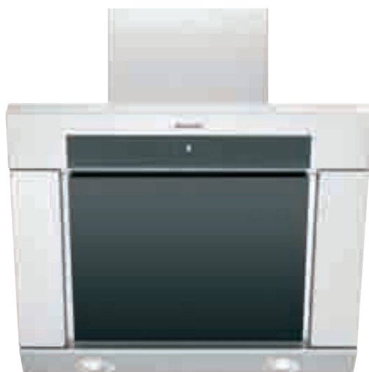
NCA 16 01 XN

Cappa a camino - Aspirazione massima 756 m 3 /h - 1 motore tangenziale con ventola - 2 lampade alogene - Controllo digitale a sfioramento - 3 velocità - Funzione booster - Timer - Aspirazione perimetrale - Filtri in alluminio anodizzato a 5 strati lavabili in lavastoviglie - Spia lavaggio filtri - Dotata di riduzione e valvola di non ritorno - Schema di incasso F 26