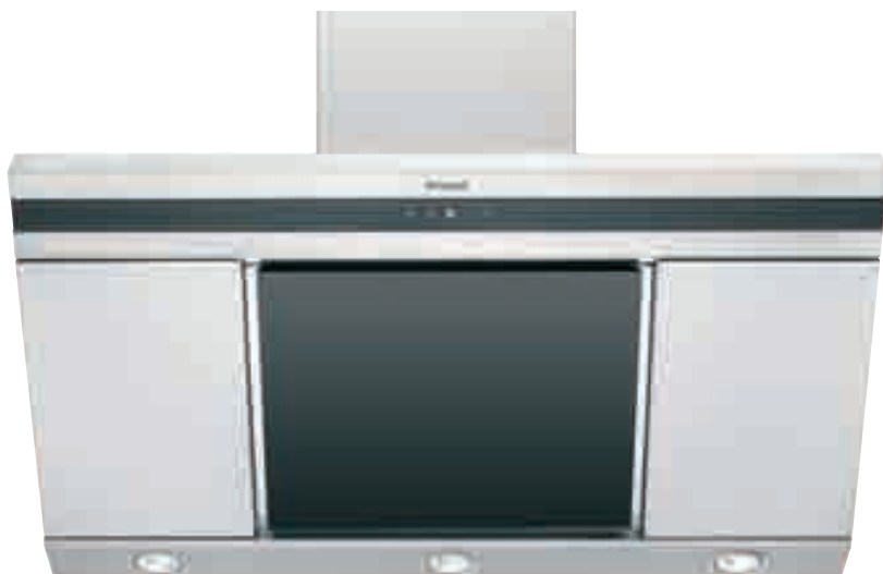
NCA 19 01 XN

Cappa a camino - Aspirazione massima 756 m 3 /h - 1 motore tangenziale con ventola - 3 lampade alogene - Controllo digitale a sfioramento - 3 velocità - Funzione booster - Timer - Aspirazione perimetrale - Filtri in alluminio anodizzato a 5 strati lavabili in lavastoviglie - Spia lavaggio filtri - Dotata di riduzione e valvola di non ritorno - Schema di incasso F 25