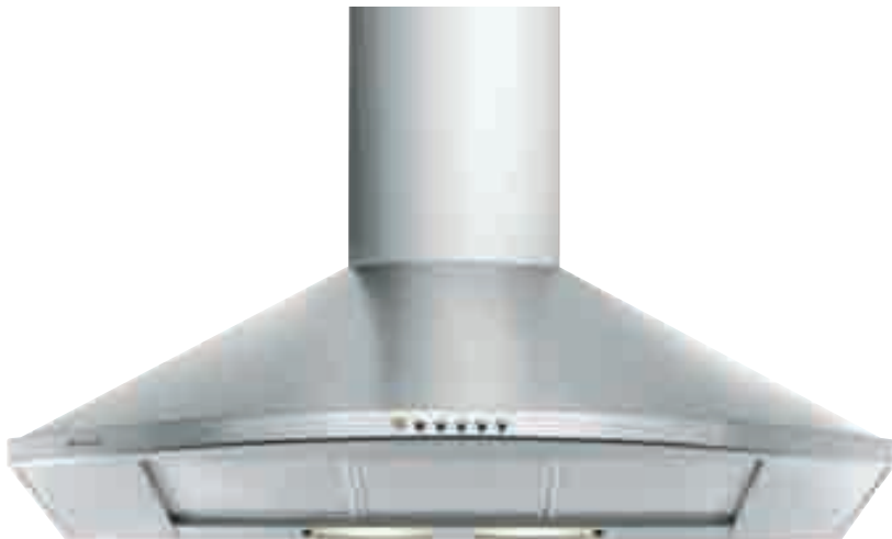
NCA 59 01 X

nero • black NCA 59 01 N ramato • copper NCA 59 01 R inox • stainless-steel NCA 59 01 X optional filtro al carbone attivo • active carbon filter TWACK 62259