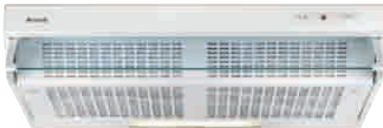
NCF 18 01 W

Cappa sottopensile con frontalino estraibile in vetro - Aspirazione massima 212 m 3 /h - 1 motore - 1 lampada - 3 velocità regolabili tramite cursore - Filtri in acrilico - Avvisatore ottico - Foratura posteriore per uscita a muro - Dotata di riduzione e valvola di non ritorno - Schema di incasso F 16