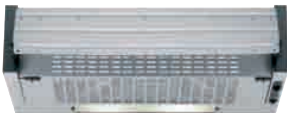
NCE 16 01 H

Cappa sottopensile - Aspirazione massima 176 m 3 /h - 1 motore - 1 lampada - 3 velocità regolabili tramite cursore - Filtri in acrilico - Avvisatore ottico - Dotata di riduzione e valvola di non ritorno - Frontalino smontabile per facile montaggio del pannello - Schema di incasso F 9