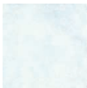
20x20 STN07 22 ■48