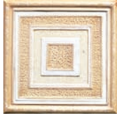
Formella Marmo Coliseum 20x20 STN0211A 22 ●36