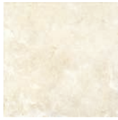
20x20 STN02 22 ■48