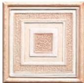
Formella Marmo Rosato 20x20 STN0511A 22 ●36