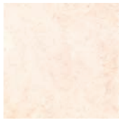
20x20 STN05 22 ■48