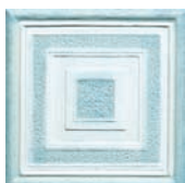
Formella Marmo Azzurro 20x20 STN0711A 22 ●36